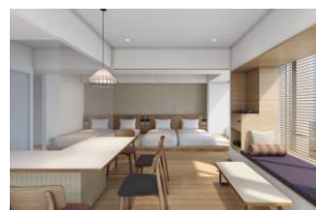
フラットフォース

室内設備 ミニキッチン（コンロ無し）、シャワー、洗面台、個別空調、Wi-Fi、ウォシュレット、日本ベッド社製ベッド、電子レンジ、冷蔵冷凍庫、電気ケトル、電話、セーフティーボックス、50V 型液晶テレビ（スマート TV アプリ）、加湿機能付き空気清浄機