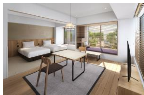
ユニバーサルツイン