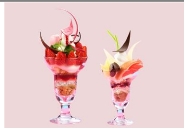
ジャンボパフェ(左)・通常パフェ(右)イメージ